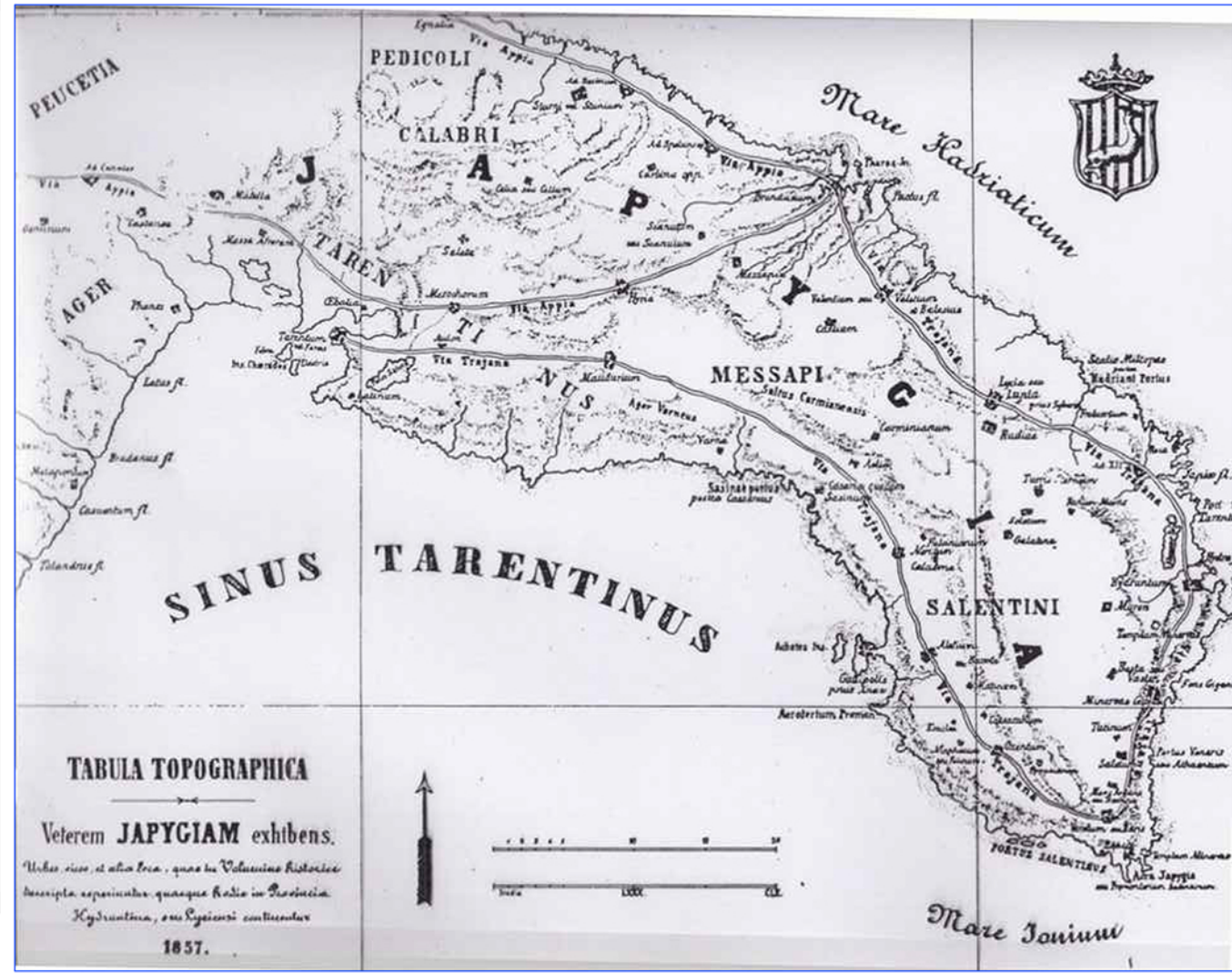
TAVOLA TOPOGRAFICA 1857